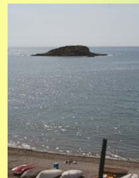
Al Illot de l'Olla , en Altea, no está permitido acceder a la zona con vegetación