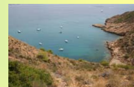
El fondeo y amarre de embarcaciones debe hacerse en las zonas habilitadas.