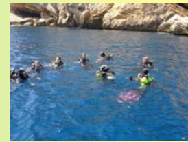
La práctica del submarinismo deportivo está permitida en las aguas del parque.

Está permitida la navegación a una velocidad siempre menor a 3 nudos.