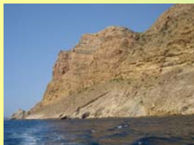
Una de las zonas de Especial Protección lo forman los acantilados de la Serra Gelada por su alto valor ecológico

El parque cuenta con una normativa específica ( Plan de Ordenación de los Recursos naturales de la Serra Gelada y su entorno litoral -DOGV 16/03/2005-) donde figura la ordenación del territorio incluido dentro del ámbito del parque, según una distribución por zonas con diferente grado de protección y de sus usos y actividades. Las diferentes zonas se pueden ver en el mapa adjunto (la zona de color morado marca el límite del parque), resumiendo a continuación algunas normas generales: