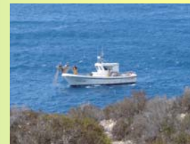
La actividad pesquera es otra actividad permitida