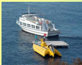
La navegación en la Illa de Benidorm debe hacerse a baja velocidad