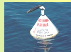
Para salvaguardar los fondos, deben utilizarse las boyas instaladas en diversos puntos del parque.