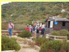
La illa puede visitarse durante el día por los lugares autorizados